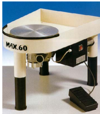
MAX weiss : feste Spritzschutzwanne mit Ablauf