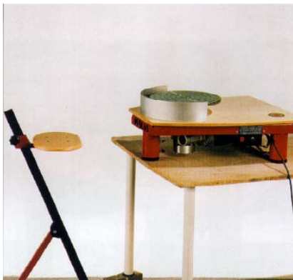
MAX rot : Tischplatte 31/58 x 72 cm abnehmbarer Spritzschutz Sitz: nicht mehr lieferbar

Die Töpferscheiben von Roderveld sind äußerst variabel gebaut und sowohl als Standmodell als auch durch die abnehmbaren Beine als Tischmodell zu benutzen.