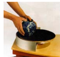
BAT Ausrüstung Preise auf Anfrage